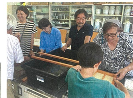
手漉き和紙ペア うまくできるかな?児童の体験をサポート

1日目の午前中は、会の作業場所で、白皮を煮る作業を行いました。3時間ほど煮て水にさらして小学校へ運びました。ここからの作業は家庭科室で児童と一緒に進みます。まず、残っている黒皮を取り除きます。そのあと、金づちのような道具で叩いて繊維をほぐします。児童70人ほどが集まった教室は、音と熱気でいっぱいになりました。暑くなってきたので、ときどき外に出て休憩して水分を取るよう先生が声をかけるとともに、楮の繊維と格闘中の背中のうちわで風を送っていました。児童たちもお互いを気づかいながら交代で根気と体力がいる作業を行っていました。