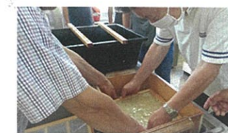
いよいよ紙漉き作業